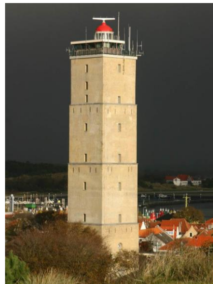
Brandaris - Terschelling