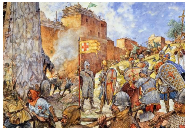
Kruisvaarders voor Jeruzalem (schoolplaat)

Als het verhaal over Mu-Lan-Pi juist is, was Columbus niet de eerste!