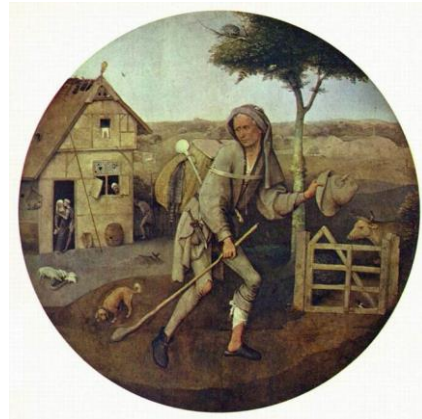
Jheronimus Bosch - De Marskramer

Op 9 augustus beginnen ze met de bouw. Niet veel later gaat het al mis.