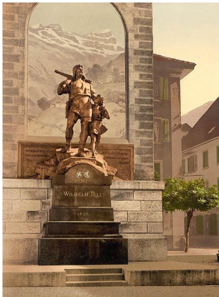
Altdorf (Zwitserland) - Monument voor Wilhelm Tell

Het verhaal gaat dat de middeleeuwen viespeuken waren, maar klopt dat wel?