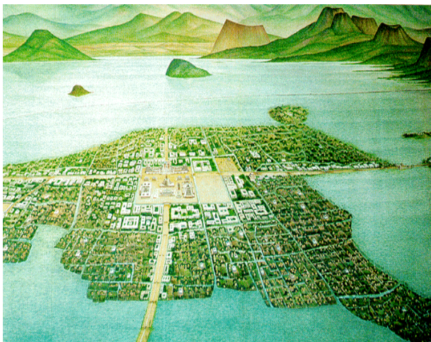
Tenochtitlan, stad in het Texcocoomeer