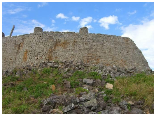
Masvingo (Zimbabwe) - het 'Grote Hof',

Toen de Romeinen het hier nog voor het zeggen hadden, zorgde de staat voor het onderhoud van de 'rijkswegen'. Nu een centrale overheid ontbreekt, is het wegonderhoud anders geregeld.