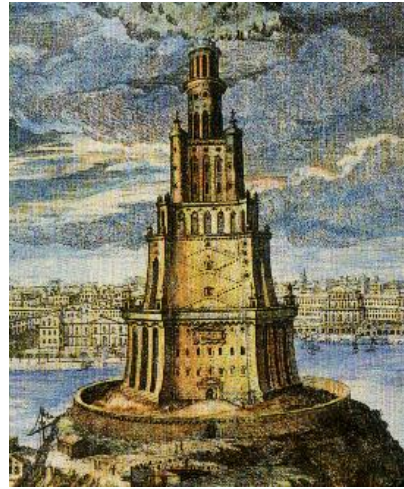
De Pharos van Alexandrië

bevestigd als symbool van zijn macht. De landvoogd beveelt Tell daarop met zijn boog een appel van het hoofd van zijn zoon te schieten. Willem Tell haalt twee pijlen uit zijn koker en schiet er één met succes door de appel. Op de vraag wat de bedoeling van de andere pijl was, antwoordt Tell dat die voor de landvoogd bestemd was als hij zijn zoon zou hebben gedood. Hierop wordt hij gevangengenomen. Maar op weg naar de gevangenis weet hij te ontsnappen en schiet hij de gehate landvoogd alsnog dood.