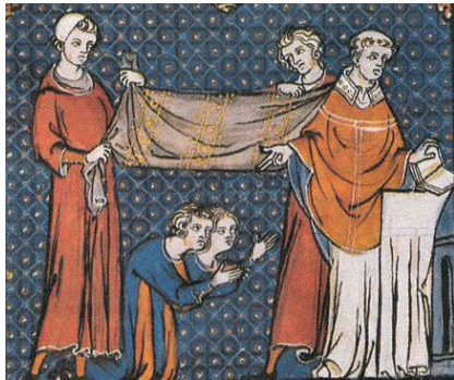
Trouwen in de Middeleeuwen

Het zal geen toeval zijn dat juist op IJsland deze verzekering kan worden afgesloten!