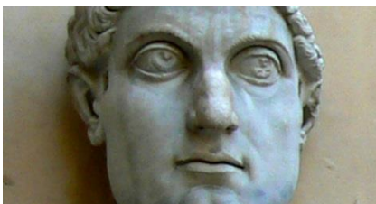
Keizer Constantijn de Grote (ca. 280-337) verbond zijn naam aan de stad