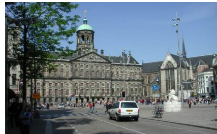
De dam die de oevers van de Amstel met elkaar verbindt.